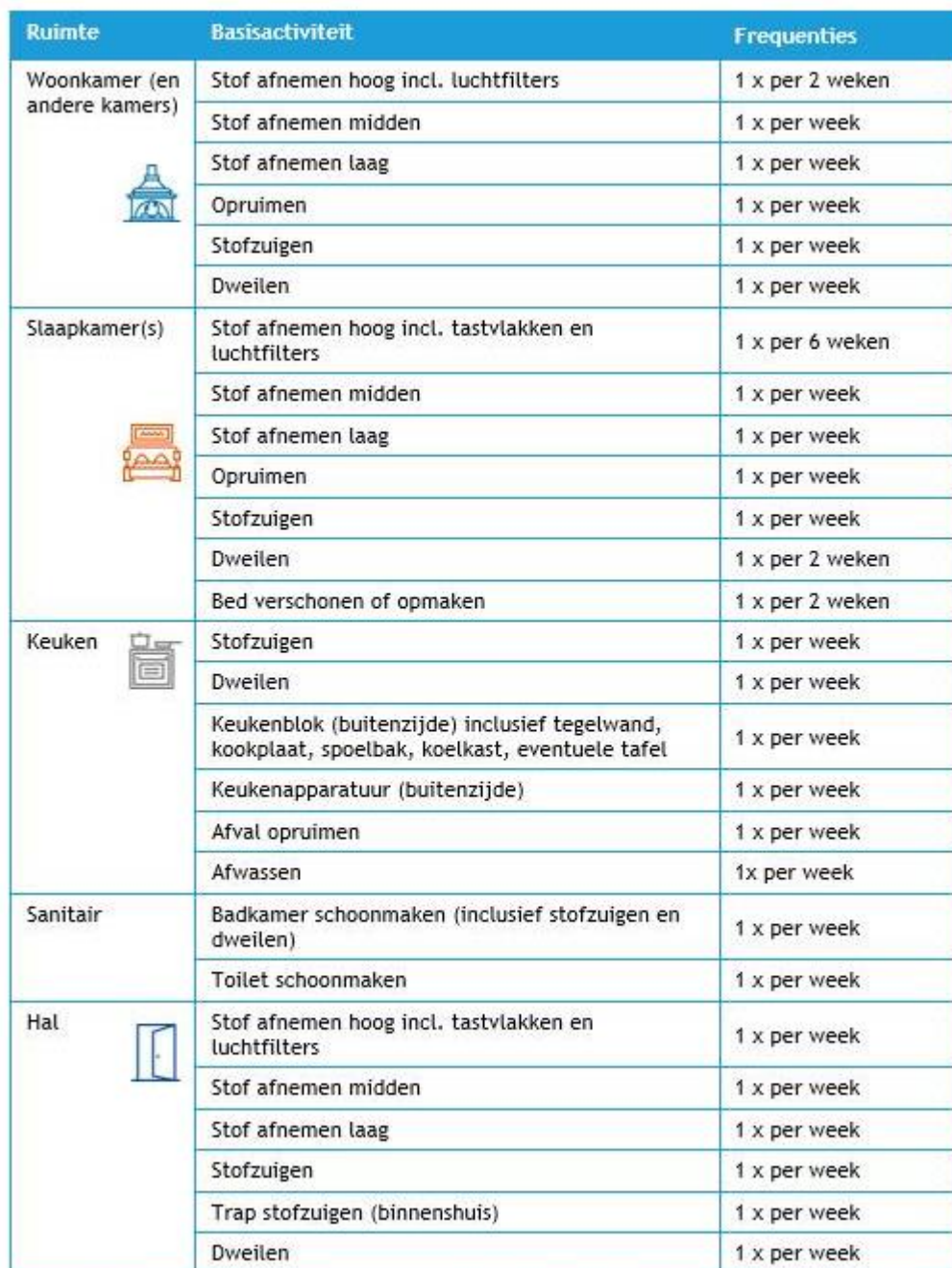
Tabel 2. Frequenties benodigd voor een schoon en leefbaar huis (basisactiviteiten)